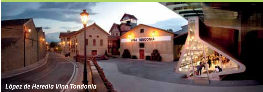
López de Heredia Vina Tondonia