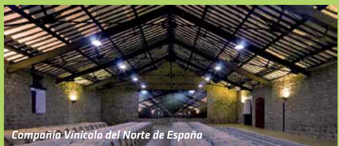
Compañía Vinícola del Norte de España

N iti jedna druga vinorodna regija u svijetu ne nudi fascinantniju mješavinu odvažne suvremene arhitekture i povijesnih vinograda od Rioje. U regiji sveprisutne srednjovjekovne povijesti i rustičnih pejzaža, kontrast avangardne arhitekture vinarija jednostavno je spektakularan.