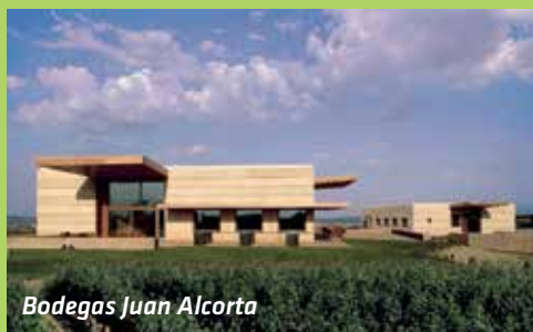
Bodegas Juan Alcorta